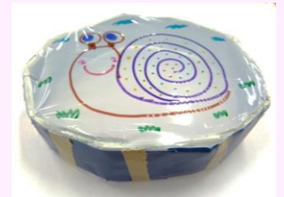
フリスビー積み木(タンパリンにもなる)