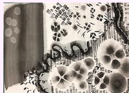
「墨で描いてみよう！」