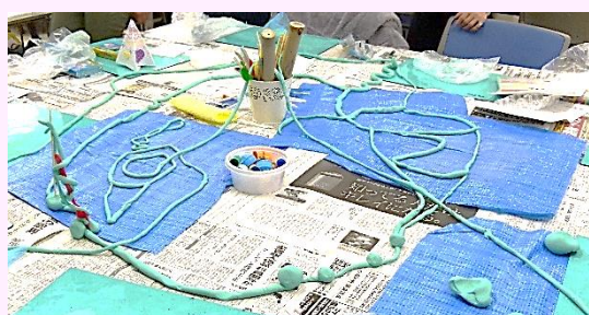
「油粘土をひもにして…」