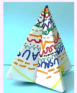
楽しい線あそび「クリスマスツリー」