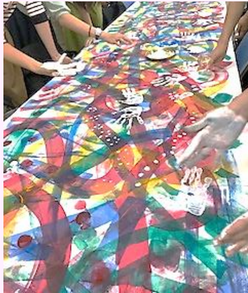
実技研修のようす

参加された方々から大好評をいただいている大阪児童美術研究会の実技研修を、内容も新たに開催します。造形活動や造形表現に苦手意識を持っている子ども達をはじめ、 どの子ども楽しく造形あそびや造形表現ができることをめざした実技研修 です。